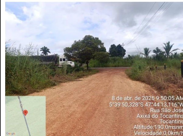
INÍCIO DO TRECHO 02 Trecho 2