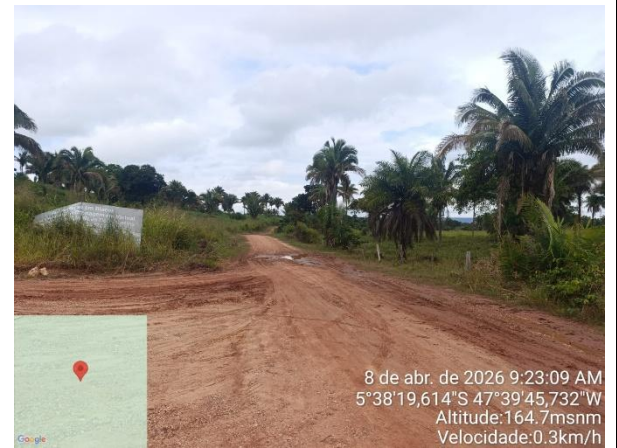
VISTA DO Trecho 2