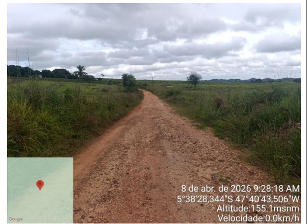
VISTA DO Trecho 2