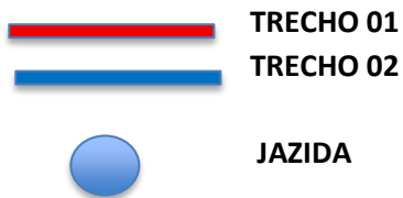
(Legenda) Mapa de Localização – dos trechos da estrada vicinal