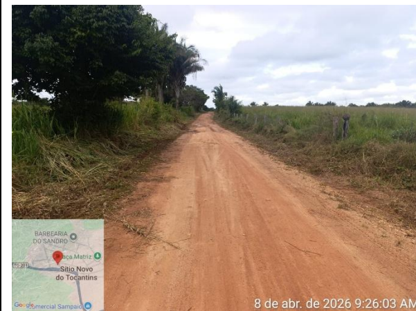
VISTA DO Trecho 2